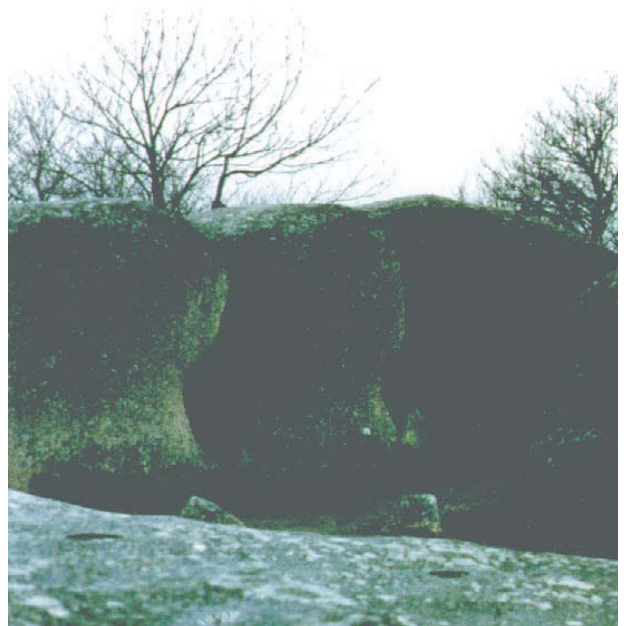
"Le berceau du diable"

"La Boussaquine" est une pierre longue de 14 m tombée obliquement. Située au nord et en bordure du plateau, elle regarde Boussac et l'originalité de sa silhouette fait qu'on lui a attribué parfois le nom de "Grenouille".