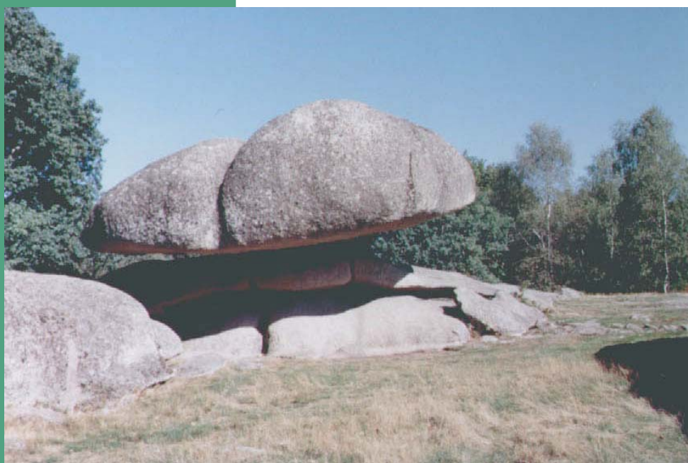
"La bascule" ou "la balance"

Canton : Boussac Commune : Toulx-Sainte-Croix Superficie : 11 ha Date de protection : 27/05/1927